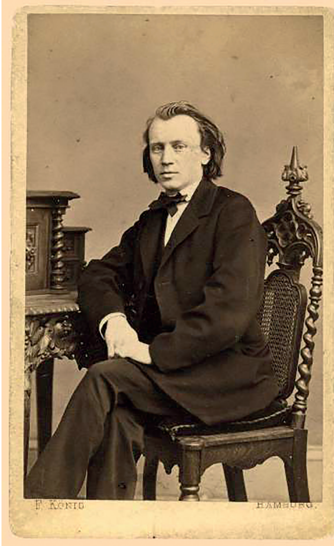
Johannes Brahms - Hamburg, 1862

Yaptığımız mektup araştırmaları da bu dijital bankanın önemli bir kısmını oluşturuyor. Brahms’ın tüm mektuplaşmalarını çok detaylı şekilde inceledik. Mektuplaşma açısından Brahms hiç de (Robert Schumann’ın bir zamanlar ifade ettiği gibi) tembel birisi olmadı. Tam tersine, 11.000’in üzerine Brahms tarafından ve Brahms’a yazılmış mektubu inceledik ve bunların hepsini BBV (Brahms-Briefwechsel-Verzeichnis) adını verdiğimiz dijital bir bankada topladık. İnternet sayfamız www.brahms-institut .