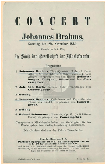
J. Brahms, Konser Programı, Viyana 29.11.1862

deli akan, Romantik dönem edebiyatıyla ilgilenen, E.T.A. Hoffmann okuyan bir gençti. Gençlik fotoğraflarını, alışık olduğumuz yaşlı Brahms ile kıyasladığımız zaman neredeyse aynı kişi olmadıklarını düşünüyoruz. Brahms'a daha farklı bir bakış açısıyla yaklaşabilmek adına bu yılki sergi için bu temayı seçtik. Sakallı, ciddi, otoriter ve ağır başlı bir "Senfoni Bestecisi" olmadan önce nasıl bir Brahms vardı? Op. 9 Schumann Varyasyonları'nı ya da Op. 10 Baladlar'ını bestelediği dönemlerde besteci olarak nasıl bir profil çiziyordu? Yeni sergimizin odak noktasında bu gibi noktalar olacak.