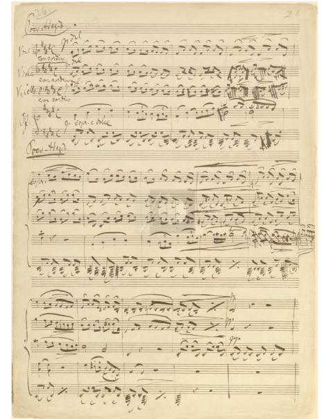
(7) J. Brahms, Op. 26 Piyanolu Dörtlü, 2. Bölüm 2. Versiyon (© Brahms Institut)