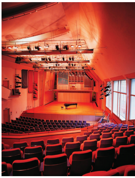
Lübeck Müzik Yüksekokulu Konser Salonu

savaşın etkileri Almanya'da da yoğun şekilde hissediliyor. Gündemdeki sıcaklığı korumaya devam eden savaş kültür - sanat kurumlarını da her anlamda harekete geçirdi. Geçtiğimiz aylarda birçok Ukraynalı müzik öğrencisine kapılarını açan Lübeck Müzik Yüksekokulu, savaş karşıtı duruşunu Brahms Festivali aracılığıyla da dile getirdi. Üniversitenin Senfoni Orkestrası'nın yer aldığı Barış Konserleri'nde, Robert Schumann ve Gustav Mahler'in yanı sıra Valentin Silvestrov'un Ukrayna için Dua adlı eserinin de dünya prömiyeri yapıldı.