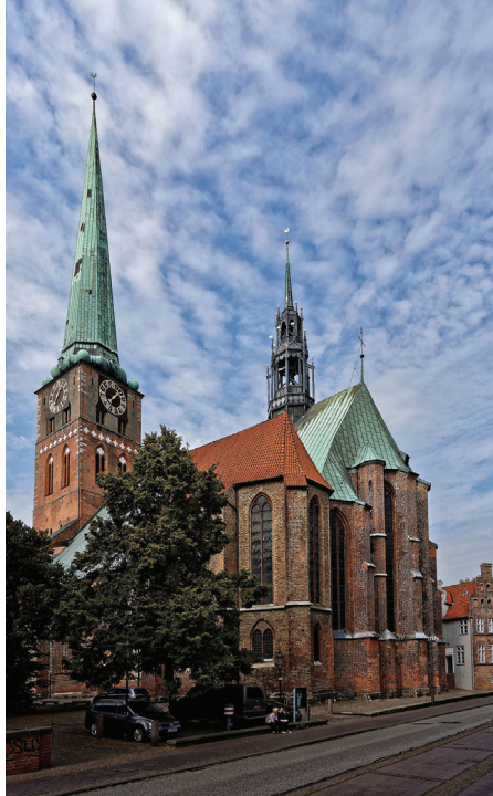
Jakobi Kilisesi Lübeck

Dietrich Buxtehude'ye kadar dayanan köklü kilise orgu geleneğiyle Lübeck, org müziği açısından da büyük önem teşkil eden