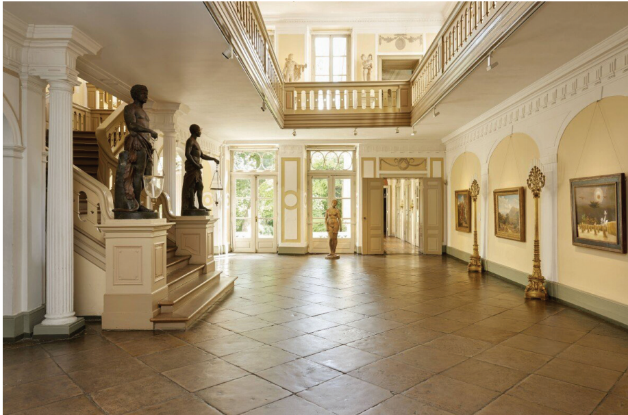
Behnhaus Drägerhaus Müzesi Lübeck

Gerçek anlamda ses getirecek bir festivale imza atabilmek için eliniz çok güçlü olmalı. Günümüz ekonomik şartlarında sponsorluk desteği bulmak özellikle büyük ölçekli organizasyonlar için zorunlu hale geldi. Alınan destek ne kadar büyükse festivaller de o kadar donanımlı, dinleyici kapasitesi yüksek salonları kiralayabilir ve uluslararası arenada isim yapmış sanatçıları programına dahil edebilir. Etkinliklerin basında yankı uyandırması açısından medya ile olan ilişkiler de çok önemli. Tüm bunların başarıya